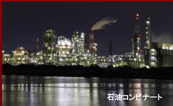
石油コンビナート