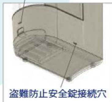
盗難防止安全錠接続穴

電源用として利用可能です ※ICカードリーダー等接続可能 (ネットワークモデル)